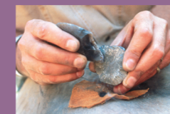
ALLUMAGE DU FEU

ENVIE DE COMPLÉTER VOTRE VISITE ? ALORS LES DÉMONSTRATIONS SONT FAITES POUR VOUS ! VENEZ OBSERVER LES GESTES ET TECHNIQUES DE NOS ANCÊTRES.