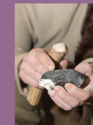
TAILLE DU SILEX